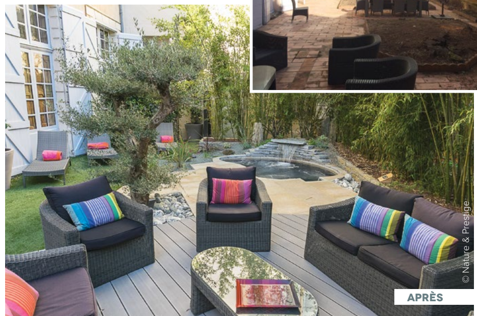
Ce petit jardin en centre d'Aix-en-Provence a été réalisé avec une zone de rafraîchissement et de bien-être comprenant un spa nature, un espace convivial avec un petit salon, et un coin repas. Des bambous ont été installés pour masquer le vis-à-vis avec les voisins et créent une ambiance cocooning.

Nous proposons un seul interlocuteur à nos clients pour réaliser l'ensemble de leur projet de A à Z. Il y a moins de concurrence, en effet, nous sommes seulement 4/5 entreprises de ce type sur le département. Il y a un an et demi, nous avons été labellisés, Jardins d'Excellence par Alliance Paysage. L'entreprise devait respecter plusieurs critères dont l'aspect communication avec la mise en place d'un plan de communication envers les particuliers : réseau sociaux, site internet..., une étude paysagère réalisée en interne dans le bureau d'études, avoir un jardin d'exposition et assurer une relation client privilégiée du début à la fin, jusqu'à la réception des travaux. Nous devons au minimum remplir à 80 % l'ensemble de chacun des critères pour bénéficier du